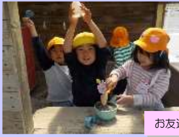
お友達、大好き♪遊ぶのって楽しいね！！