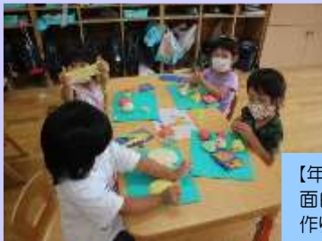
【年少組の小麦粉粘土】 面白い感触を味わいながら好きな物を作りました。