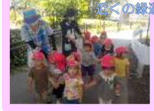
近くの緑道をお散歩！