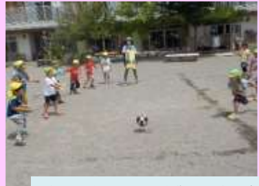
自分たちでチームを作って楽しめる ドッジボールやサッカー◎