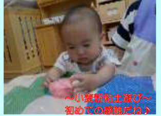
〜小袋粘土遊び〜 初めての感触だね♪