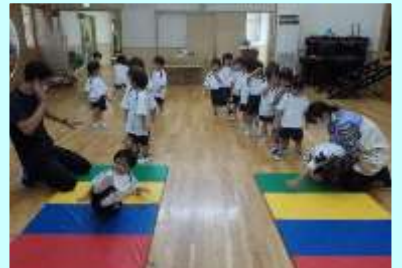
週に1回の体操教室。マット運動や 跳び箱にも挑戦しています！