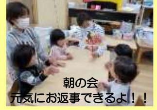
朝の会 元気にお返事できるよ！！