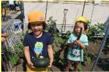
育てた野菜を収穫したり、トウモロコシの皮をむいたり、食育にも積極的に取り組んでいます。