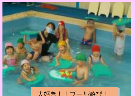
大好き！！プール遊び！