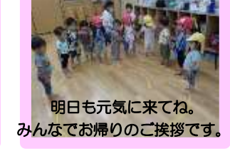
明日も元気に来てね。 みんなでお帰りのご挨拶です。