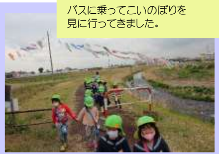
バスに乗ってこのぼりを見に行ってきました。