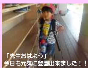
「先生おはよう」 今日も元気に登園出来ました！！