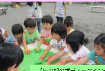
【年少組のボディペインティング】【年中組の泥んこ遊び】 何とも言えない感触です！